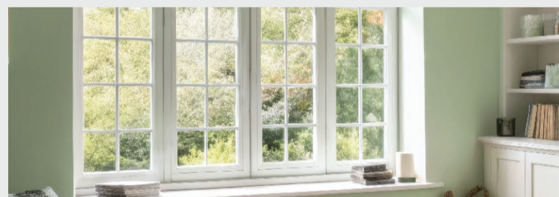
ДЕРЕВЯННЫХ ОКОННЫХ РАМ, ПОДОКОННИКОВ, ОКОННЫХ ОТКОСОВ